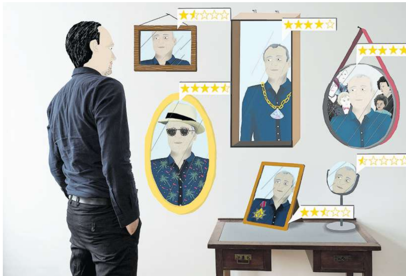
Je nach Alter und Beruf lohnen sich freiwillige Einzahlungen in die Pensionskasse mehr oder weniger.

Auch für Jüngere könnten sich Einkäufe eignen, wenn die Pensionskasse einen sogenannten 1e-Plan anbiete, sagt Spring. Mit solchen Plänen können Versicherte, die mehr als 126 900 Fr. pro Jahr verdienen, für Lohnbestandteile oberhalb dieser Summe die Anlagestrategie selber bestimmen und auch die Umverteilung umgehen. Auch für bestimmte Berufsgruppen können frühe Einkäufe in die Pensionskasse sinnvoll sein, etwa bei selbständigen Professionen wie Arzt